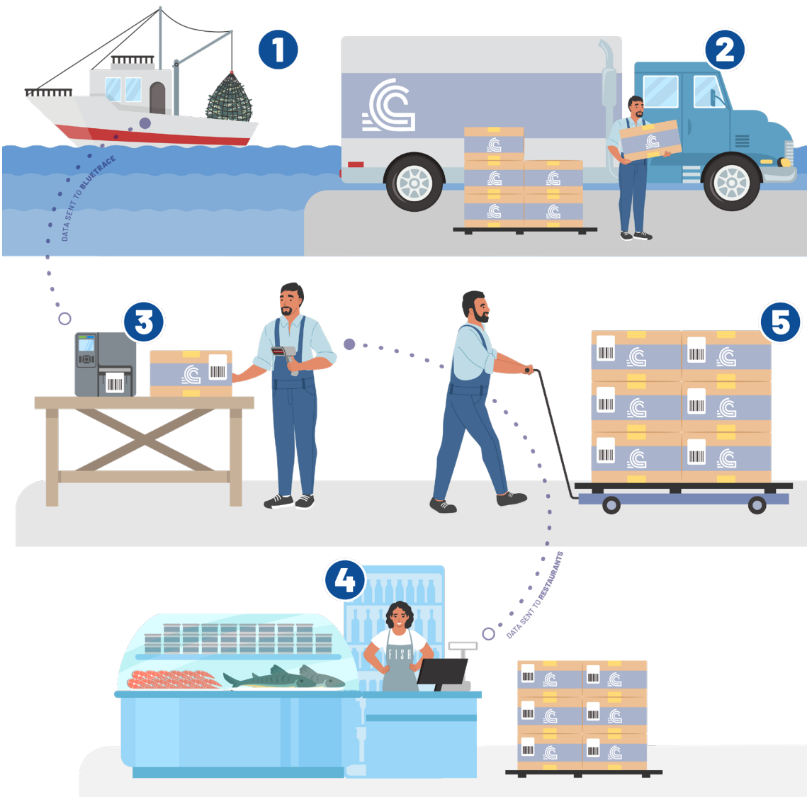
Diagrama 1: As remessas da BlueTrace processam desde frutos do mar frescos até a entrega em restaurantes. À esquerda estão listadas as 5 etapas do processo.