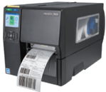
T4000/T4000 RFID-Serie Kompakte Industriedrucker der Enterprise-Klasse