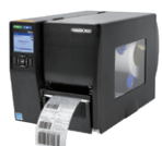
Serie T6000e/T6000e RFID Stampanti industriali professionali di fascia media