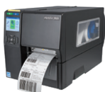
Serie T4000/T4000 RFID Stampanti industriali compatte di livello professionale