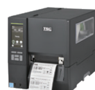
Serie MH Stampanti industriali ad alte prestazioni