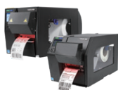
T6000e ODV-2D/T8000 ODV-2D Stampanti integrate per l'ispezione dei codici a barre