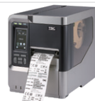
Serie MX Stampanti industriali ad alte prestazioni